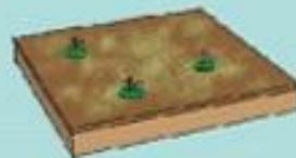
Surfaces semi-ouvertes Ratio = 0.5