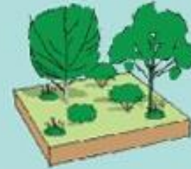
Espaces verts en pleine terre Ratio = 1