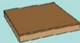
Surfaces semi-perméables Ratio = 0.3