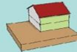
Façades végétalisées Ratio = 0.3