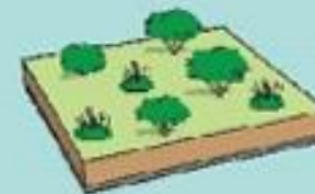
Infiltration d'eau de pluie Ratio = 0.2