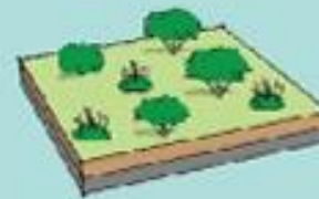
Espaces verts sur dalle 2 Ratio = 0.7