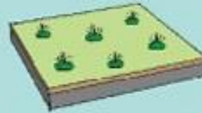
Espaces verts sur dalle 1 Ratio = 0.5