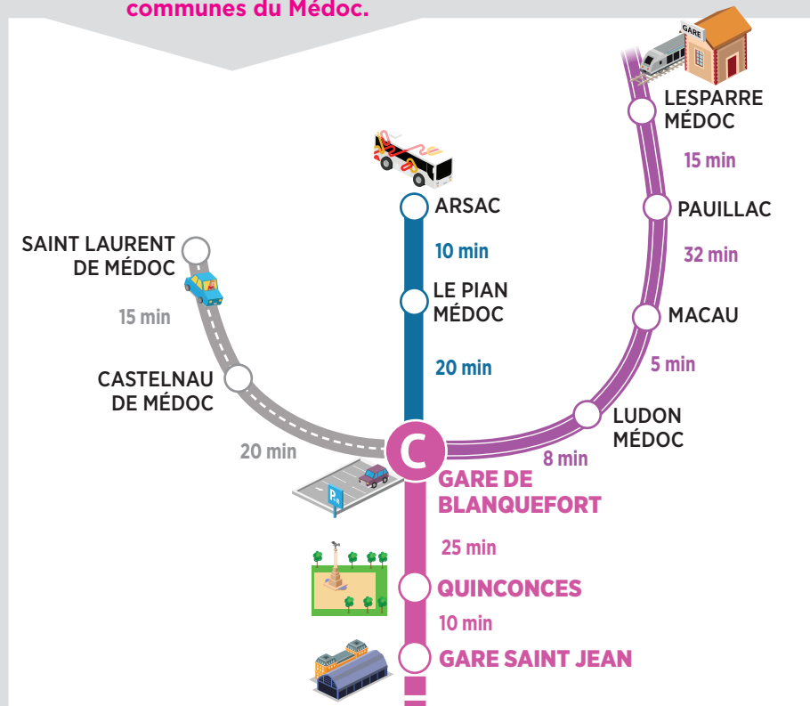
SCHÉMA présentant des exemples de temps de parcours au départ de certaines communes du Médoc.

POUR CALCULER VOTRE ITINÉRAIRE DEPUIS LA GARE DE BLANQUEFORT