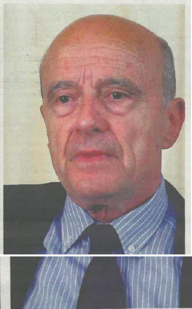
Nathalie Arthaud et Alain Juppé sont les plus forts à l'exercice du parrainage.