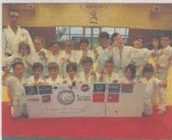
Les jeunes pousses du Judo-Club.