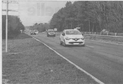
La RD 1215 est toujours au cœur des enjeux politiques locaux.

89 millions d'euros : c'est le montant investi par le Département entre 2006 et 2016 pour l'aménagement et l'entretien des routes du Médoc. Dans ces investissements figurent, par exemple, le recalibrage et le renforcement de la RD107 entre Saint-Médard-en-Jalles, Le Temple et Le Porge (5,5 millions d'euros), les travaux d'aménagement et de sécurisation réalisés sur la RD1215 (12 millions d'euros), la déviation de la Lacanau (9,2 millions d'euros). Lors de ses vœux de début d'année, Pascale Got avait bien dit qu'il est illusoire de rêver au Graal d'une mise à deux fois deux voies de la RD1215 sur toute sa longueur. En revanche, la députée et conseillère départementale socialiste annonçait l'existence de