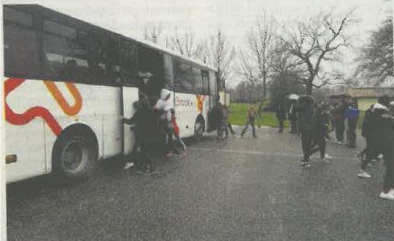
Exercice d'évacuation d'un bus, mardi, par une classe de sixième du collège de Canterane.

Selon un vieil adage, les pédagogues ne craignent jamais de répéter et de vérifier les acquisitions. C'est ainsi, que chaque année, au collège de Canterane, une journée de formation pour la sécurité autour et à l'intérieur des bus scolaires est prévue. Pour l'année scolaire 2016-2017, elle a eu lieu mardi, à proximité du gymnase.