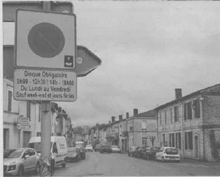
La rue Victor-Hugo reste le point noir pour la circulation en ville.

Certes, le centre-ville de Castelnau-de-Médoc n'est pas le labyrinthe de ruelles de la ville de Lutèce (Lyon) où Astérix et Obélix parviennent à semer les soldats romains*. Néanmoins, la circulation n'y est pas des plus simples pour les véhicules. Sens interdits, rues à sens uniques et places de parking posent problème dans un contexte de forte poussée démographique. La population de la commune, environ 4 500 habitants actuellement, pourrait gagner 2000 nouveaux Castelnaudais à l'horizon 2025. Autant dire que les problèmes actuels de circulation et de stationnement doivent être pris à bras-le-corps sans attendre. Riverains, visiteurs occasionnels mais surtout commerçants du centre-ville s'agacent de ces problèmes récurrents. Une grogne accrue avec des travaux qui perdurent et