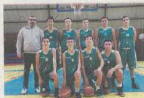
Les cadets 2 vainqueurs de NBA Bordeaux.

En D2 masculin, Côteaux Garonne, 47 ; Castelnau, 74 : avec les anciens Alonzeau et Aricque dominant la raquette, les garçons du coach Brunelle ont dominé cette rencontre sans jamais trembler. Menant de 20 points à la pause, ils accentuaient leur avance à 30 points aux 30 minutes, contrôlant ensuite le money-time pour s'imposer indiscutablement. Dans l'objectif de terminer dans les