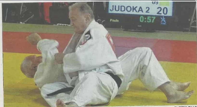
Parmi les participants, certains judokas s'affrontent dans la catégorie des plus de 75 ans (M10).