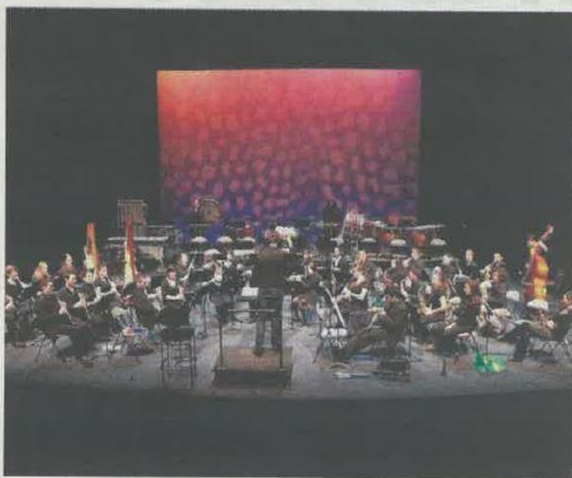
L'harmonie de Bordeaux-Bastide.

Entrée libre, sans réservation, dans la limite des places disponibles Informations sur scapa-castelnau.fr