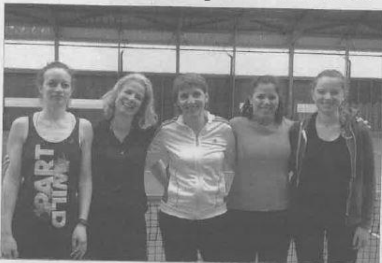
La joie des cinq joueuses victorieuses.