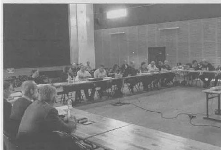
Le conseil communautaire s'est réuni à Castelnau-de-Médoc.