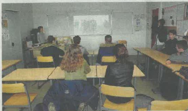
Les élèves visionnent le court-métrage, en présence des deux professeurs.