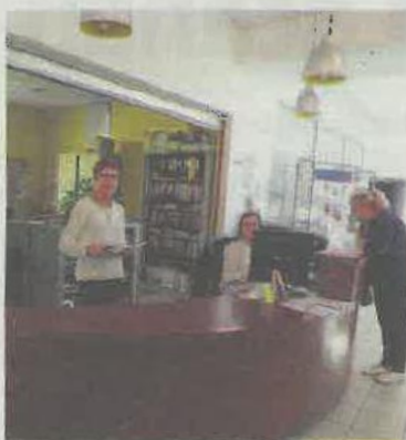
Vers un nouvel environnement pour les démarches administratives.

Pour l'aménagement de la place de l'Église, 164 493 euros seront mobilisés sur fonds propres pour un budget total de 419 064 euros. Pour les travaux rue de la Fontaine, la com-