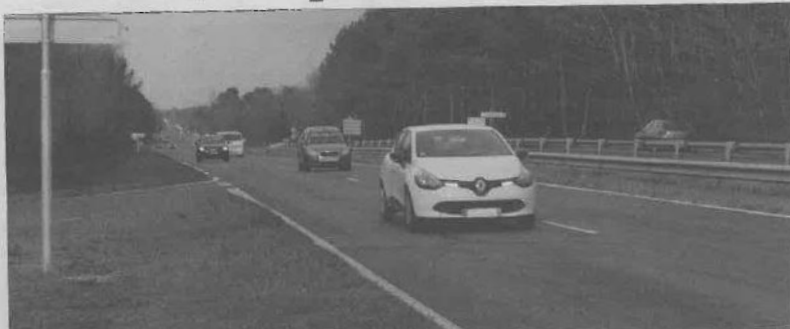
Jusqu'à 13 000 véhicules par jour empruntent la RD 1215 sur certains tronçons.

Pour beaucoup, la RD 1215 avec ses deux heures pour relier Le Verdon-sur-mer à Bordeaux est vue comme un point faible notamment pour le développement économique. Le sujet a longtemps irrité Pascale Got, également députée et présidente de Gironde Tourisme, qui entend souvent dire qu'il faudra bientôt plus de temps pour faire Bordeaux-Le Verdon que Bordeaux-Paris (avec la LGV). « Sur les deux heures, la moitié est consacrée à parcourir l'agglomération bordelaise avec les difficultés de circulation que tout le monde connaît, à répondu Pascale Got pour répondre à une provocation amicale d'Alain Meyre lors de l'assemblée générale de l'Organisme de défense et de gestion Médoc, Haut-Médoc et Listrac-Médoc du 16 février dernier. En Médoc, je n'ai jamais vu de