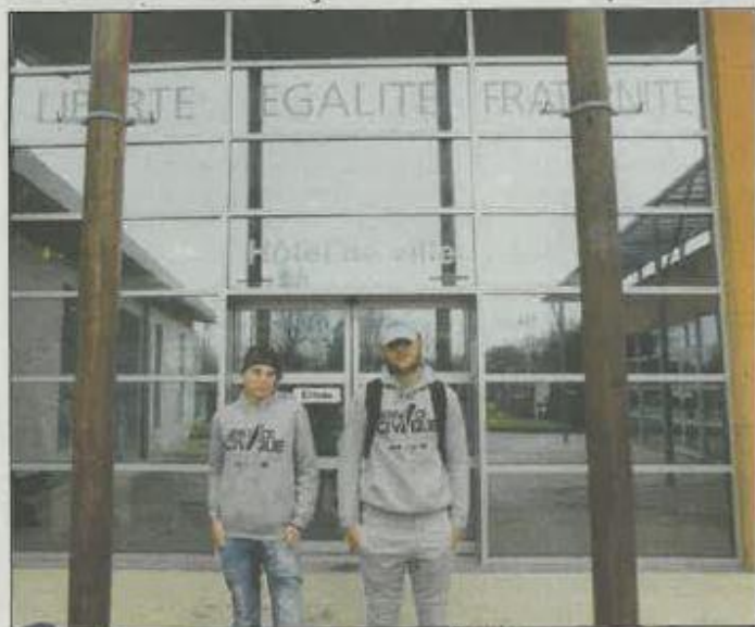
Deux jeunes sont actuellement en service civique à la mairie de Castelnau.