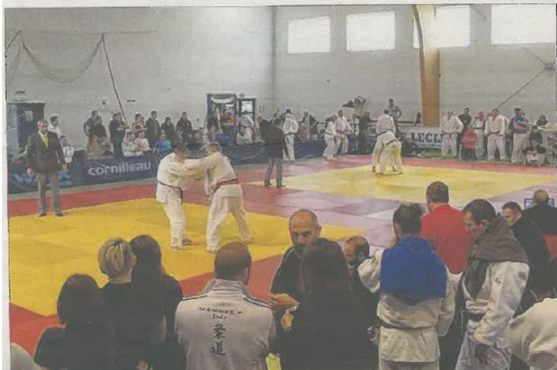
La compétition s'est déroulée à Sainte-Hélène cette année.