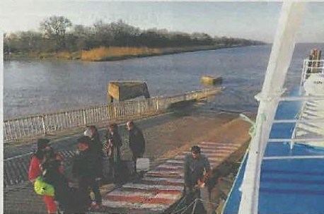
Embarquement à Larmarque, uniquement pour les piétons