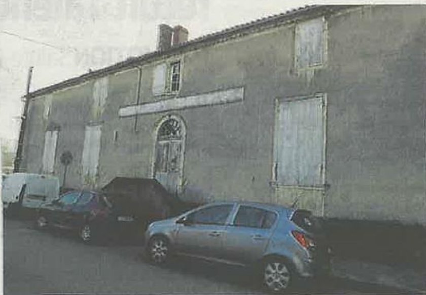
Le bâtiment de l'ancienne gendarmerie va servir pour les manœuvres des pompiers.

Et l'adjointe au maire de préciser : « Cette décision devait être votée dans un délai de vingt-et un jours suivant la fin de l'exercice budgétaire, lequel est bouclé au 31 décembre 2016. L'urgence s'imposait, ce qui explique pourquoi nous