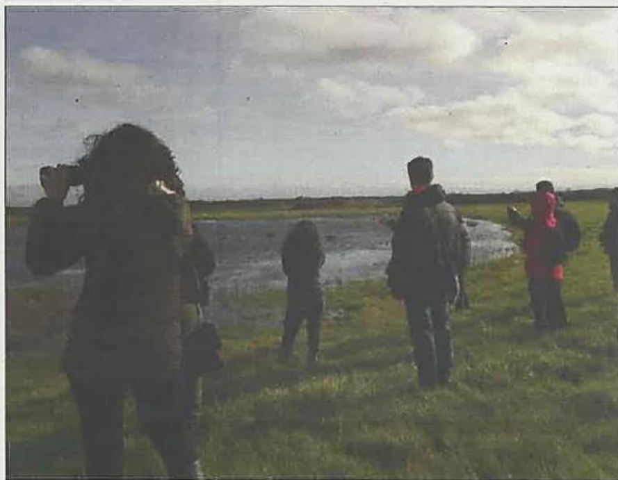
Une longue semaine pour découvrir les marais et zones humides du Médoc.

Ces différentes animations débiteront le vendredi 27 janvier par la visite du marais de Lafite à Pauillac de 9h30 à 14h avec un pique-nique et visite de chai. Le marais de la Berle à Lacanau, celui de Lupian à Hourtin, autant de zones humides qui garantissent l'éco-diversité de la région et œuvrent sur la maîtrise des crues et la gestion de l'eau douce. Une soirée de clôture avec conférence est programmée le lundi 6 février à la salle Moulin