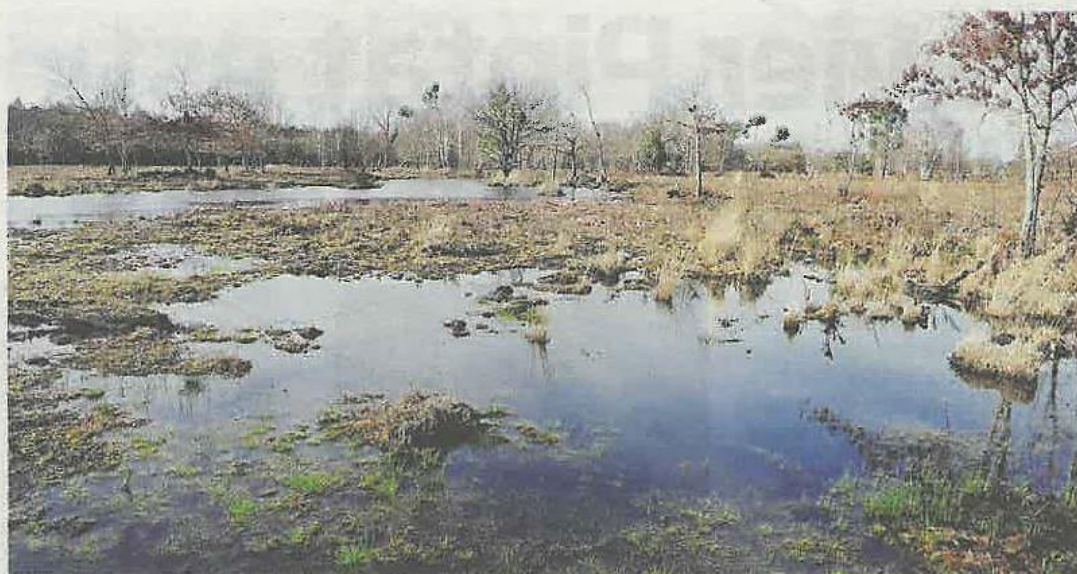
Les marais boisés, des zones riches en flore et en faune à préserver.