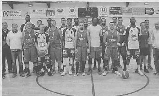
Les équipes de Castelnaud et Marmande lors du tournoi de Tresses.