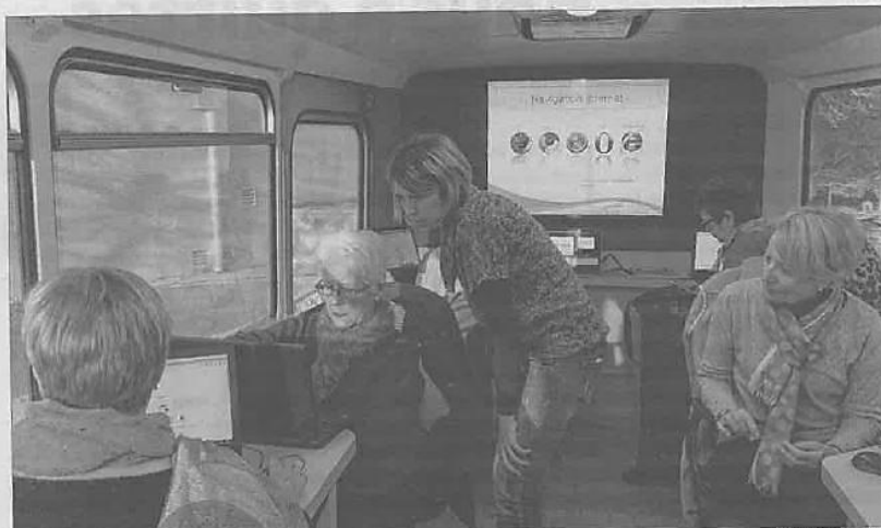
Les stagiaires d'un jour avec leur formatrice