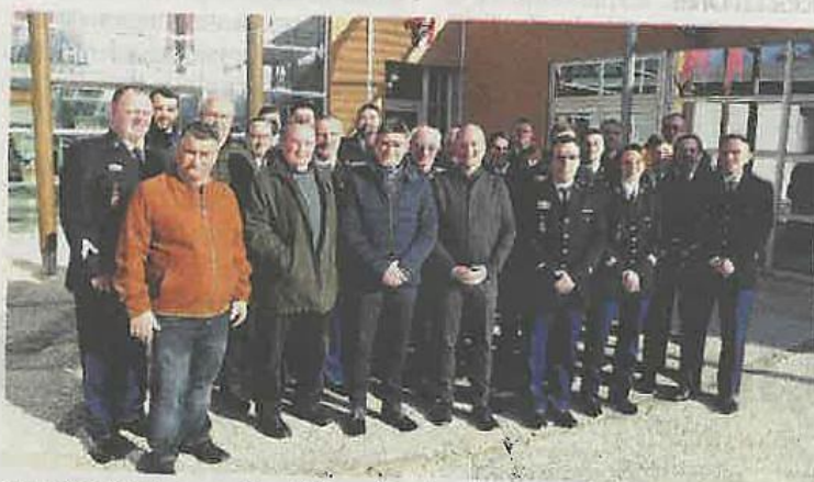
Les gendarmes ont invité les élus à une réunion informelle, suite à l'inspection annuelle de la brigade.

La brigade compte aujourd'hui 15 militaires, soit sept gradés, cinq gendarmes et trois gendarmes ad-