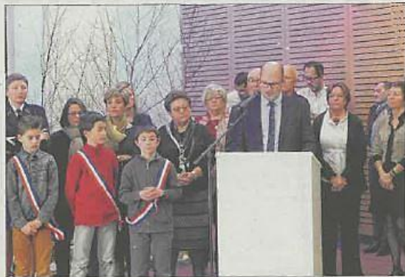
Le maire, entouré de l'équipe municipale, du conseil municipal des Jeunes et des « officiels » présents, dont la députée Pascale Got.