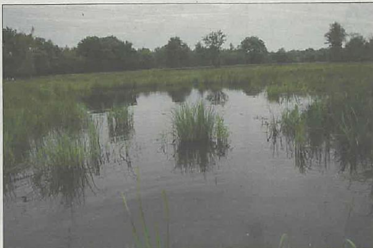
Le territoire du Médoc regorge de sites en zones humides, qui assurent la prévention des risques naturels.