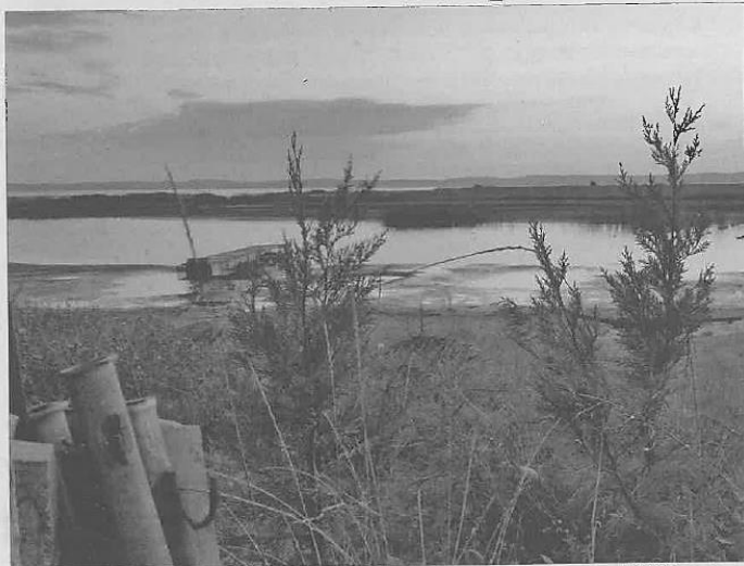
Pour les sorties nature, prévoyez des bottes et vêtements de pluie de couleur sobre.