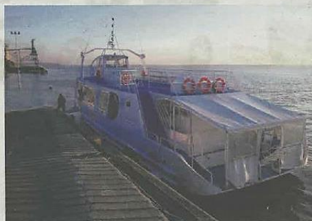
Le bateau « Les 2 Rives »

Pendant toute la période transitoire, les horaires de traversée sont inchangés.